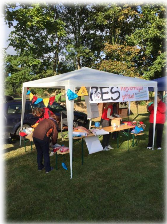
Obrázek 2- stánek PNP akce Sen Zvířat 2015

Dne 6.9.2015 jsme se také zúčastnili naší první umístovací výstavy Sen zvířat. I přes nepříznivé počasí považujeme tuto akci za velmi povedenou. Podařilo se umístit fenku Dali, která byla adoptována skvělými páničky.